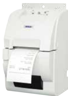
Impressora na posição vertical fixada na parede